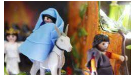
La Virgen y la Navidad, en clicks de Playmobil: la Visitación, el pesebre, los Reyes Magos...