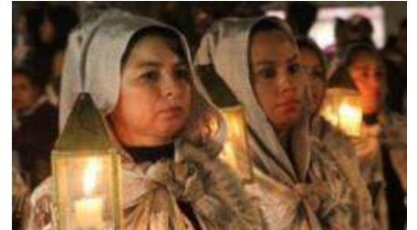
Censo en México: la Iglesia gana 5 millones de fieles en 10 años, pero pierde 5 puntos porcentuales