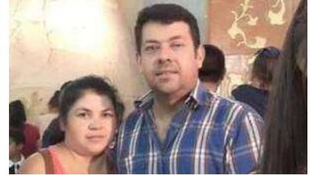
Herido grave en la carótida, en el suelo, esperaba ayuda... y vio una extraña Mujer con hábito