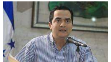
Honduras inicia la reforma de su Constitución para incluir explícitamente la prohibición del aborto