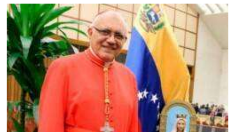
La Iglesia de Caracas denuncia los ataques y confiscaciones de Maduro contra la prensa crítica