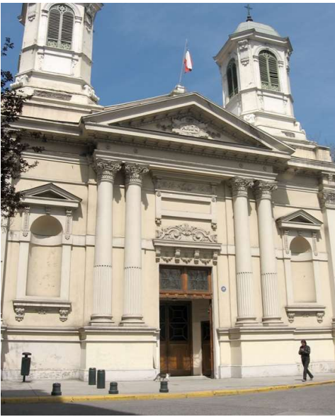
Así era habitualmente el Templo de los Ángeles Custodios, monumento nacional