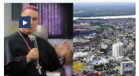
El obispo de Buenaventura, Colombia, denuncia «guerra real, con granadas», entre bandas criminales