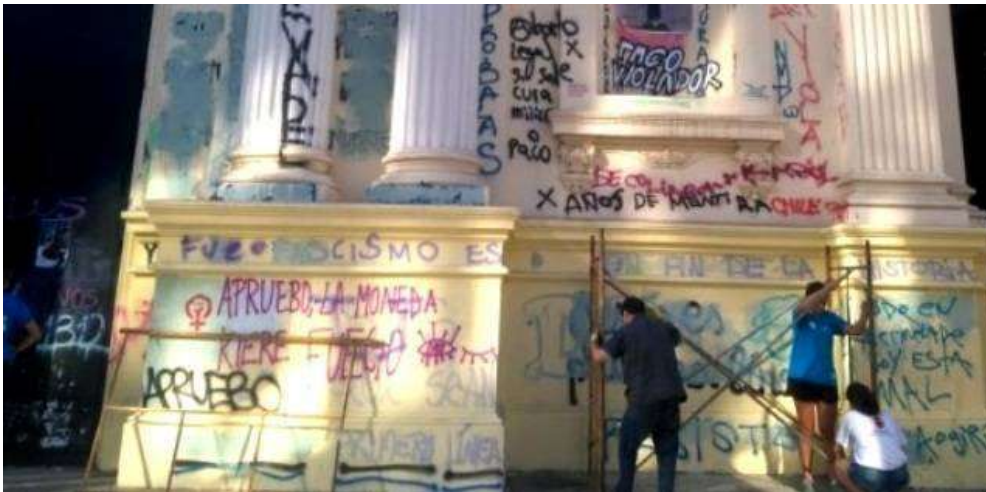
Voluntarios reparan la fachada de los Ángeles Custodios en Santiago de Chile, monumento nacional vandalizado por feministas abortistas